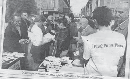
У акцији учествовали и представници градских општина