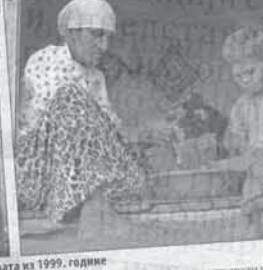
Присилна миграција последица је рата из 1999. године