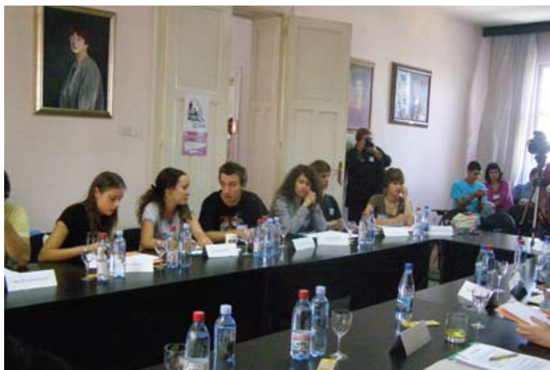
Na slici: Okrugli sto - Interkulturalnost i mladi, 23. septembar 2009. godine.