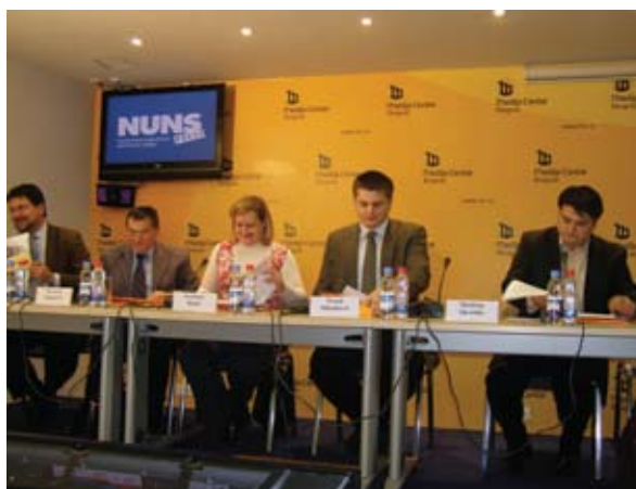
Na slici: Konferencija za novinare (Beograd, Medija centar, 29.10.2009. godine)