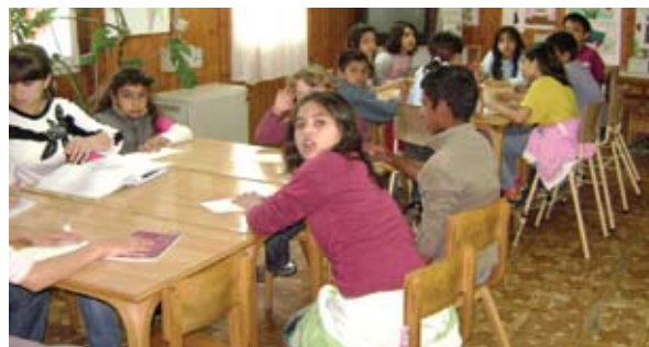
Na slici: Radionica sa decom u Prokuplju