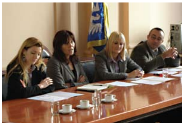
Na slici: Okrugli sto "Dijaspora za razvoj Užica"