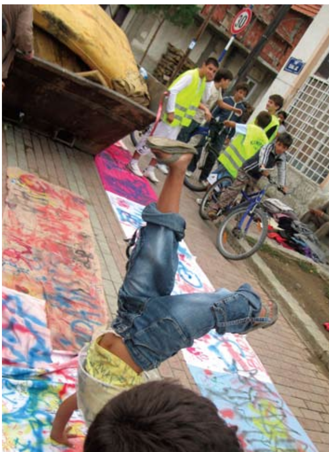
Na slici: Ulična akcija u Vranju - Ima neka čar biti đubretar