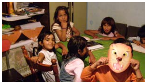
Na slici: Radionica sa decom iz beogradskog naselja Krnjača