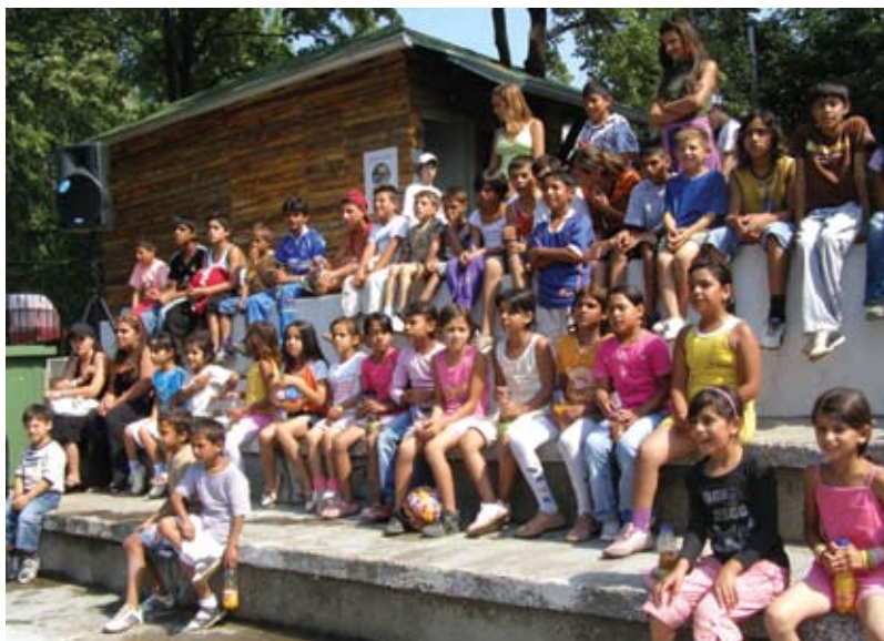
Na slici: Svetski dan izbeglica

Dvadeset i dva volontera Grupe 484 organizovala su akciju prikupljanja priloga za paketiće. Tokom akcije, oni su kontaktirali oko 300 preduzeća i ustanova i 7 preduzeća je odlučilo da učestvuje: Egmont, Soko Štark, Jaffa, Podravka, Svislion Takovo, JamakM (Igračke Pino) i Copy Planet. Zajedno sa njima organizovali smo prevoz i prijem robe. Učenici Osnovne škole "Vuk Karadžić" iz Sremčice, napravili su 252 paketa ličnih stvari kao što