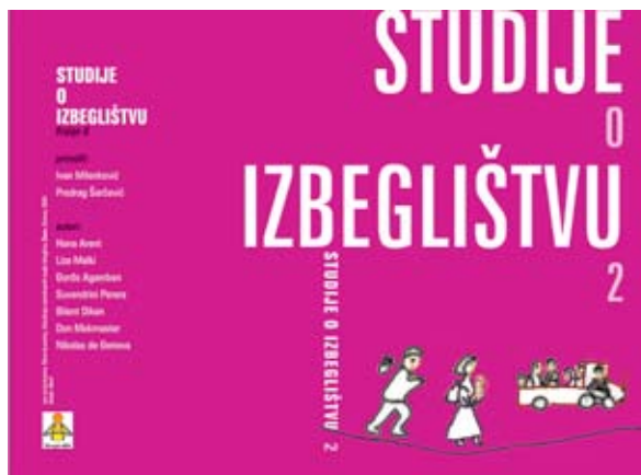
Korice knjige: Studije o izbeglištvu 2

Objavljena je druga sveska "Studije o izbeglištvu", u kojoj su tekstove Hane Arent, Lize Malki, Đorđa Agambena, Suwendrini Perere, Bilent Dikena, Don Mekmastera i Nikolasa de Đenove, priredili Ivan Milenković i Predrag Šarčević. Cilj ove publikacije objašnjavaju urednici: "Uvući problem izbeglištva u teorijsku ravan znači odupreti se opravdanom, ali nedovoljnom zahtevu za hitnom akcijom, odmaći se od hitnosti naloga za neodložnim delovanjem i problem postaviti u drugim terminima i iz drugih perspektiva u odnosu na one koji preovlađuju. Smatramo da je takav pristup uslov bez kojeg problem izbeglištva ne samo da ne može da se reši, nego se on ne može ni postaviti na način koji bi pružio zadovoljavajući odgovor."